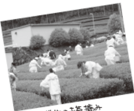
中学生のお茶摘み

この荒茶は選別などの仕上げ作業を経て品評会へ出品されます。また、当日は地元産業者である白川茶について学習している黒川小学校3年生の子供たちもこの様子を見学に訪れ、お茶の新芽を実際に手に取りながら説明を聞き、知識を深めていました。