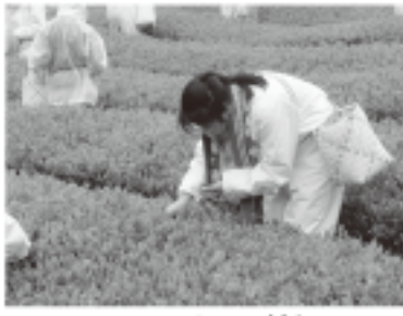
丁寧に摘む中学生