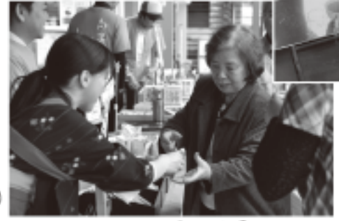
旬のかわりを楽しむ来場者